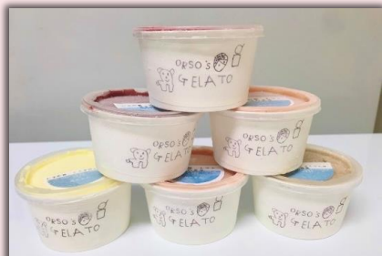
仁木町産の果物や野菜を使用したジェラート・ソルベ