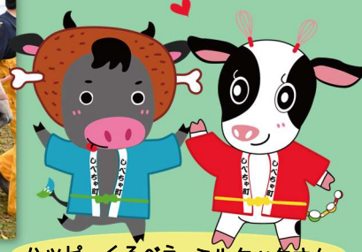
ハッピーくるべえ ミルクックさん